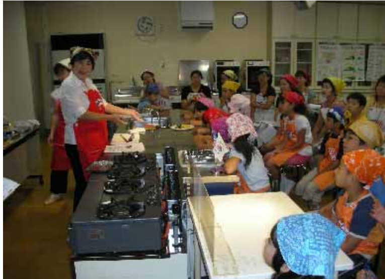
7/31(火)、さいたま市で開催した親子料理教室の様様